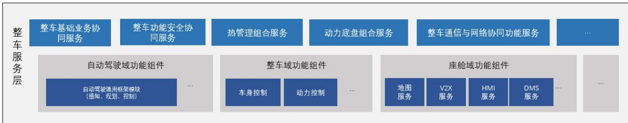
11 图 3 整车服务层结构

9 整车服务层是基于系统基础服务的实现，并对应用服务提供整车级通用服务的层级。整车服务层 10 通常需要跨越多个功能域，实现多个功能域的组合复用性。