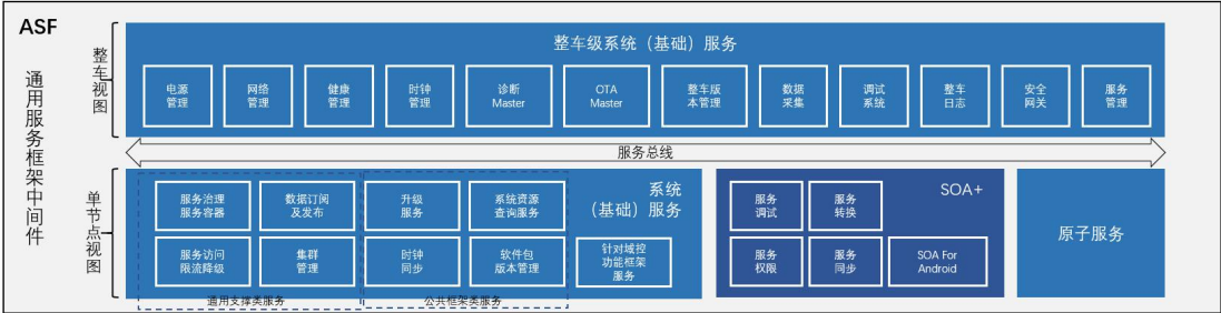
图 2 ASF 分层结构

20 ASF 主要分为三个层次分别为：基础系统服务层、服务总线、整车系统服务层。